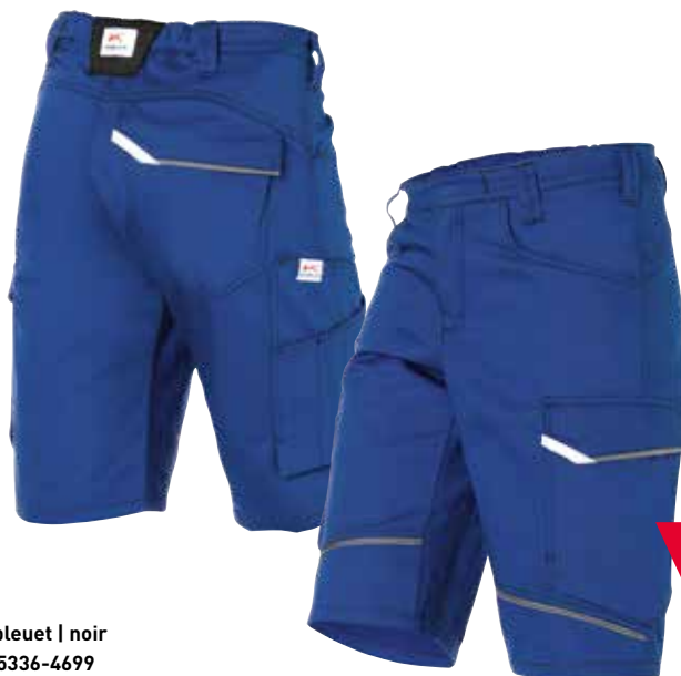
bleu bleuet | noir 2440 5336-4699 40 - 66