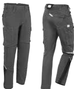
anthracite | noir 2340 1301-9799

40-66 (avec extension d'ourlet jusqu'à 5 cm), 25-31