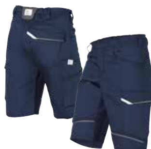
bleu foncé | anthracite 2440 5336-4897 40 - 66