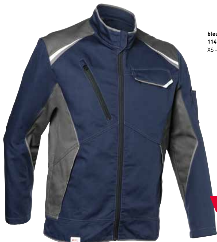
bleu foncé | anthracite 1140 5336-4897 XS - 4XL