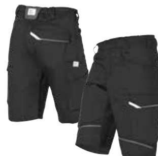
noir | anthracite 2440 5336-9997 40 - 66

ÉGALEMENT DISPONIBLE EN BLANC | ANTHRACITE : PAGE 29