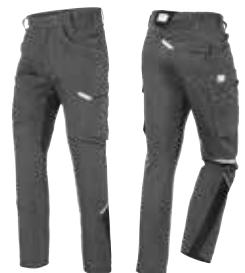
anthracite | noir 2340 5336-9799

40 - 66 (avec extension d'ourlet jusqu'à 5 cm), 25-31