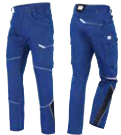
bleu bleuet | noir 2340 5336-4699

40 - 66, 25 - 31 (avec extension d'ourlet jusqu'à 5 cm)