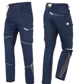
bleu foncé | anthracite 2340 5336-4897

40 - 66, 25 - 31 (avec extension d'ourlet jusqu'à 5 cm)