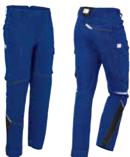
bleu bleuet | noir 2340 1301-4699

40-66 (avec extension d'ourlet jusqu'à 5 cm), 25-31