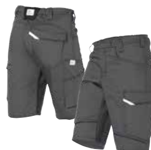
anthracite | noir 2440 5336-9799 40 - 66