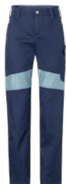
Dunkelblau | Eisblau 2560 3342-4844 D34 – D54