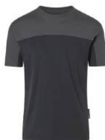
Schwarz | Dunkelgrau 5220 6206-9998* XS-4XL