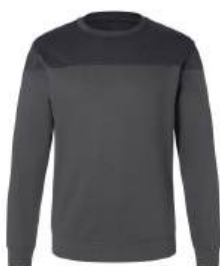
Dunkelgrau | Schwarz 5222 6406-9899* XS-4XL