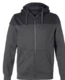
Dunkelgrau | Schwarz 5223 6406-9899* XS-4XL