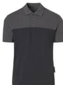
Schwarz | Dunkelgrau 5221 6207-9998* XS-4XL

*Voraussichtlich verfügbar ab Sommer 2026.