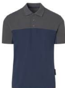
Dunkelblau | Dunkelgrau 5221 6207-4898* XS-4XL