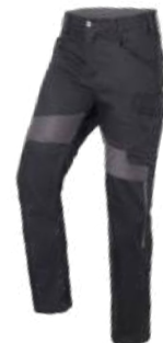
Schwarz | Dunkelgrau 2260 3342-9998 40N - 66N, 44L - 58L, 44K - 60K