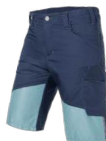
Dunkelblau | Eisblau 2460 3342-4844 40N – 66N