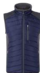
Dunkelblau | Dunkelgrau 7342 5201-4898* XS-4XL

*Voraussichtlich verfügbar ab Sommer 2026.