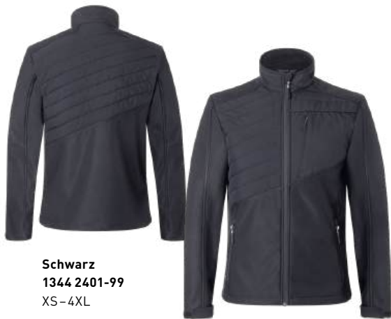
Schwarz 1344 2401-99 XS-4XL