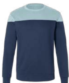
Dunkelblau | Eisblau 5222 6406-4844* XS-4XL