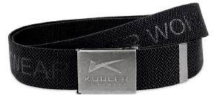
Schwarz 8303 9217-99 ONE SIZE