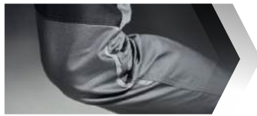
Stretchgewebe aus Elastomultiester.