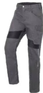
Dunkelgrau | Schwarz 2260 3342-9899 40N - 66N, 44L - 58L, 44K - 60K