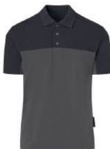
Dunkelgrau | Schwarz 5221 6207-9899* XS-4XL