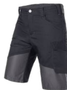
Schwarz | Dunkelgrau 2460 3342-9998 40N – 66N