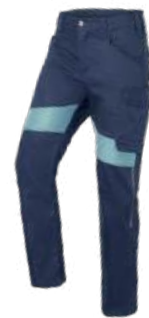
Dunkelblau | Eisblau 2260 3342-4844 40N - 66N, 44L - 58L, 44K - 60K