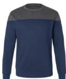
Dunkelblau | Dunkelgrau 5222 6406-4898* XS-4XL