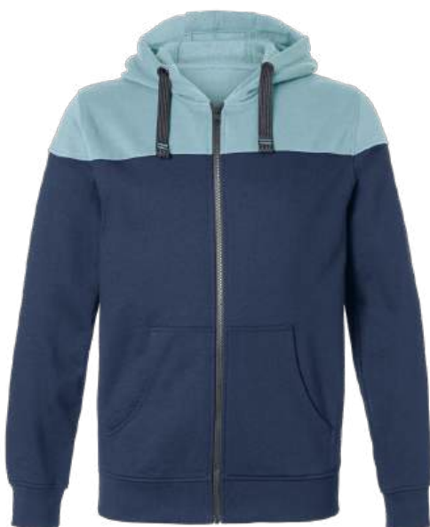
Dunkelblau | Eisblau 5223 6406-4844* XS-4XL