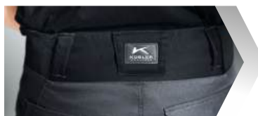
Große, seitliche Stretcheinsätze.