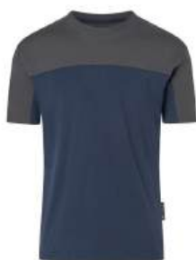
Dunkelblau | Dunkelgrau 5220 6206-4898* XS-4XL