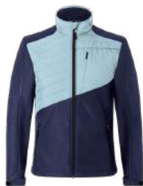
Dunkelblau | Eisblau 1344 2401-4844* XS-4XL