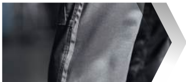
Dezente, dunkle Reflex-Elemente.