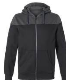
Schwarz | Dunkelgrau 5223 6406-9998* XS-4XL

*Voraussichtlich verfügbar ab Sommer 2026.