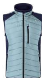
Eisblau | Dunkelblau 7342 5201-4448* XS-4XL