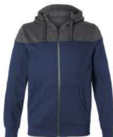
Dunkelblau | Dunkelgrau 5223 6406-4898* XS-4XL