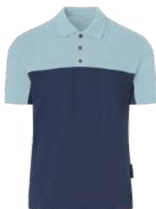
Dunkelblau | Eisblau 5221 6207-4844* XS-4XL