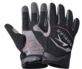
Schwarz | Mittelgrau 8001 9414-9995 S (6), M (6,5), L (7), XL (8), XXL (9), 3XL (10)