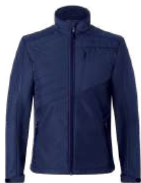
Dunkelblau 1344 2401-48* XS-4XL