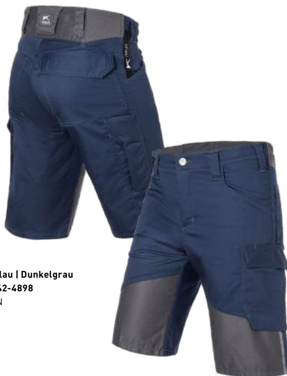
Dunkelblau | Dunkelgrau 2460 3342-4898 40N – 66N