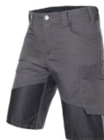
Dunkelgrau | Schwarz 2460 3342-9899 40N – 66N