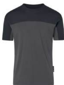
Dunkelgrau | Schwarz 5220 6206-9899* XS-4XL