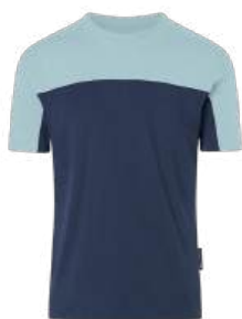
Dunkelblau | Eisblau 5220 6206-4844* XS-4XL