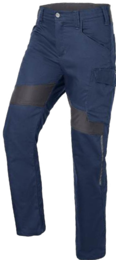
Dunkelblau | Dunkelgrau 2260 3342-4898 40N - 66N, 44L - 58L, 44K - 60K