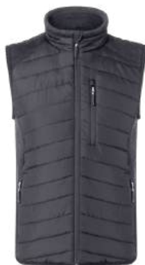
Schwarz | Dunkelgrau 7342 5201-9998 XS-4XL