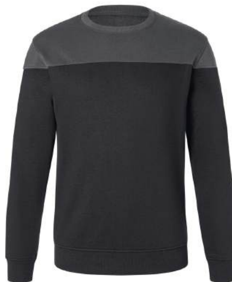
Schwarz | Dunkelgrau 5222 6406-9998* XS-4XL