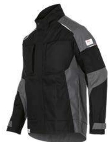
Schwarz | Anthrazit 1250 3421-9997 XS-4XL