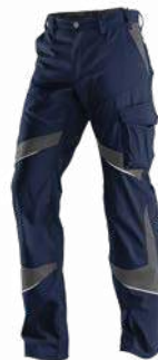
Dunkelblau | Anthrazit 2550 5365-4897 D34-D54