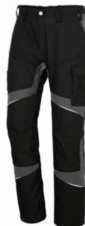
Schwarz | Anthrazit 2150 5365-9997 40-66, 90-118, 25-31