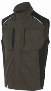
Oliv | Schwarz 7250 5365-6699 XS-4XL