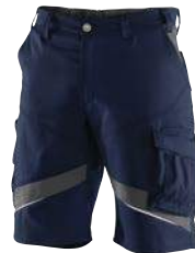
Dunkelblau | Anthrazit 2450 5365-4897 40-66