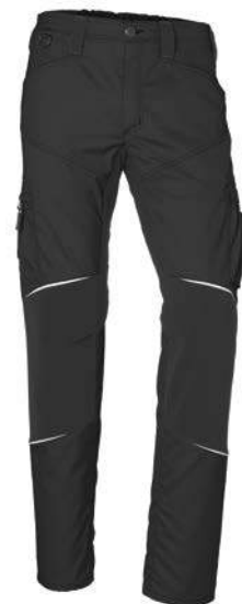
Schwarz 2855 5365-99 40-66, 90-118