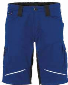
Kbl.blau | Schwarz 2950 5231-4699 40-64