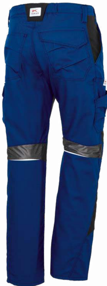
Kbl.blau | Schwarz 2150 5365-4699 40-66, 90-118, 25-31