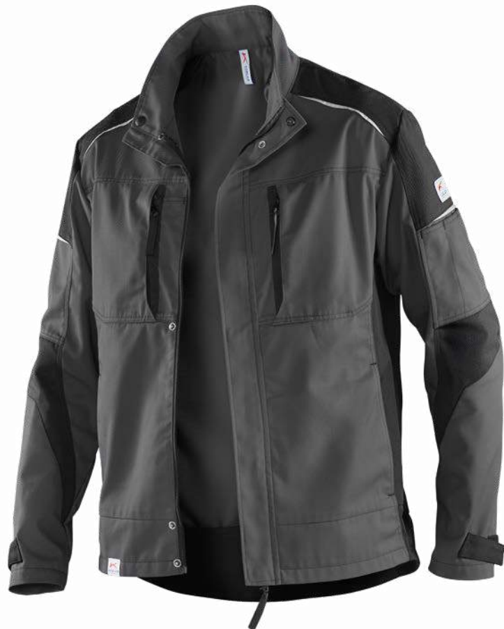
Anthrazit | Schwarz 1250 5365-9799 XS-4XL