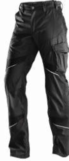
Anthrazit 2550 5365-97 D34-D54