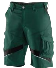
Moosgrün | Schwarz 2450 5365-6599 40-66