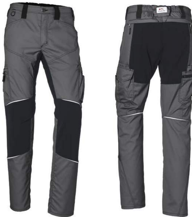
Anthrazit | Schwarz 2850 5231-9799 40-66, 90-118, 23-31