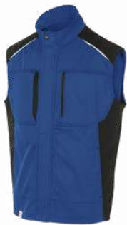
Kbl.blau | Schwarz 7250 5365-4699 XS-4XL