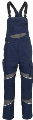
Dunkelblau | Anthrazit 3450 3421-4897 40-66, 90-118, 23-31