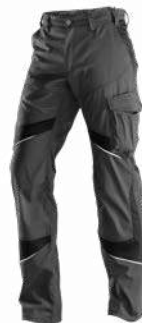
Anthrazit | Schwarz 2550 5365-9799 D34-D54