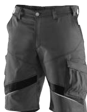
Anthrazit | Schwarz 2450 5365-9799 40-66