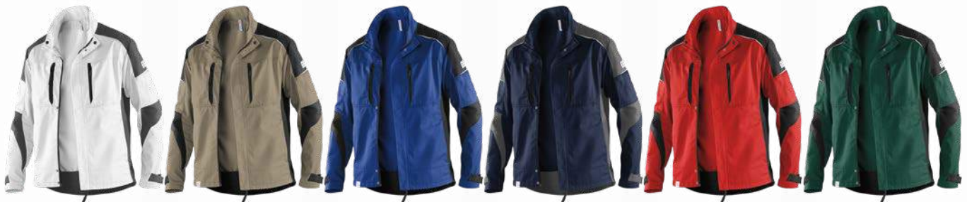
Weiß | Anthrazit 1250 5365-1097 XS-4XL