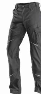
Schwarz 2550 5365-99 D34-D54