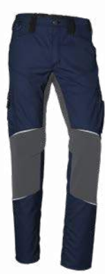
Dunkelblau | Anthrazit 2850 5231-4897 40-66, 90-118, 23-31