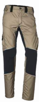
Sandbraun | Schwarz 2850 5231-2599 40-66, 90-118, 23-31