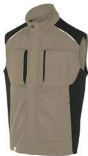
Sandbraun | Schwarz 7250 5365-2599 XS-4XL