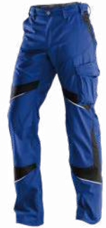
Kbl.blau | Schwarz 2550 5365-4699 D34-D54