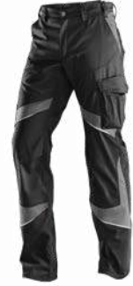
Schwarz | Anthrazit 2550 5365-9997 D34-D54