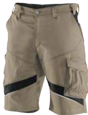
Sandbraun | Schwarz 2450 5365-2599 40-66