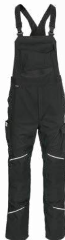
Schwarz 3450 3421-99 40-66, 90-118, 23-31