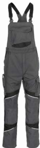
Anthrazit | Schwarz 3450 3421-9799 40-66, 90-118, 23-31