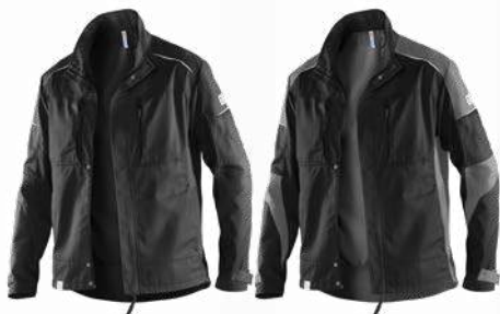
Schwarz 1250 5365-99 XS-4XL