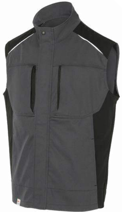
Anthrazit | Schwarz 7250 5365-9799 XS-4XL