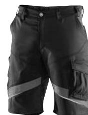
Schwarz | Anthrazit 2450 5365-9997 40-66