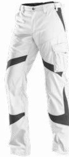
Weiß | Anthrazit 2550 5365-1097 D34-D54