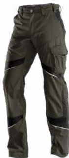
Oliv | Schwarz 2550 5365-6699 D34-D54