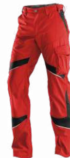
Mittelrot | Schwarz 2550 5365-5599 D34-D54