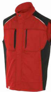
Mittelrot | Schwarz 7250 5365-5599 XS-4XL