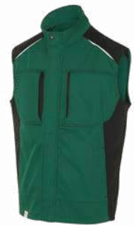
Moosgrün | Schwarz 7250 5365-6599 XS-4XL