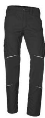
Schwarz 2850 5231-99 40-66, 90-118, 23-31