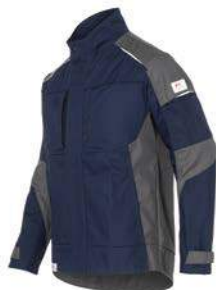
Dunkelblau | Anthrazit 1250 3421-4897 XS-4XL