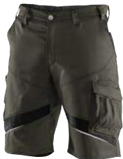
Oliv | Schwarz 2450 5365-6699 40-66