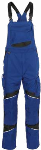
Kbl.blau | Schwarz 3450 3421-4699 40-66, 90-118, 23-31