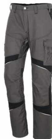
Anthrazit | Schwarz 2150 5365-9799 40-66, 90-118, 25-31