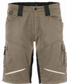
Sandbraun | Schwarz 2950 5231-2599 40-64