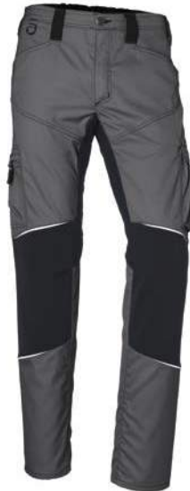
Anthrazit | Schwarz 2855 5365-9799 40-66, 90-118