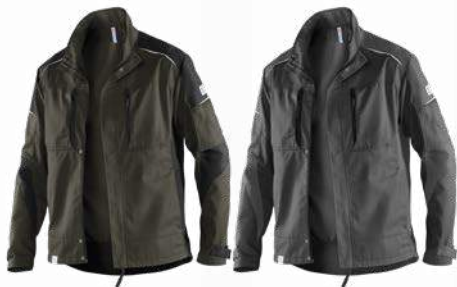
Oliv | Schwarz 1250 5365-6699 XS-4XL