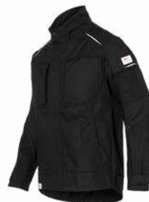
Schwarz 1250 3421-99 XS-4XL