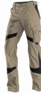
Sandbraun | Schwarz 2550 5365-2599 D34-D54