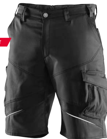
Schwarz 2650 5365-99 D34-D54