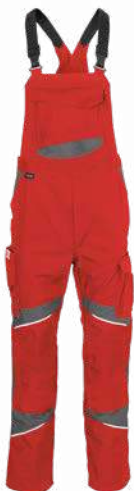
Mittelrot | Anthrazit 3450 3421-5597 40-66, 90-118, 23-31