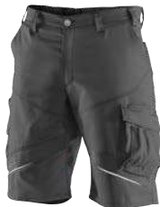
Anthrazit 2450 5365-97 40-66