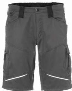
Anthrazit 2950 5231-97 40-64