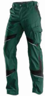
Moosgrün | Schwarz 2550 5365-6599 D34-D54