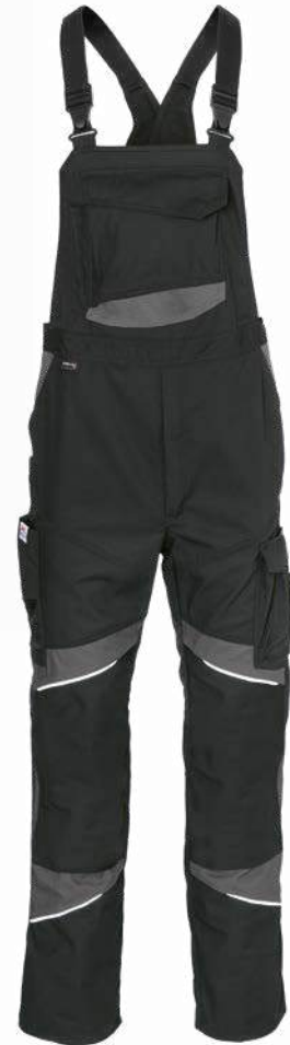
Schwarz | Anthrazit 3450 3421-9997 40-66, 90-118, 23-31