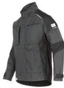
Anthrazit | Schwarz 1250 3421-9799 XS-4XL