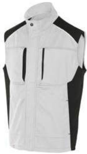
Weiß | Anthrazit 7250 5365-1097 XS-4XL