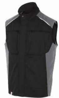
Schwarz | Anthrazit 7250 5365-9997 XS-4XL