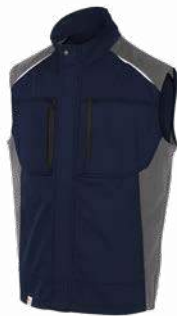
Dunkelblau | Anthrazit 7250 5365-4897 XS-4XL