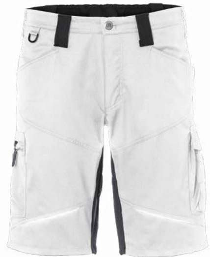
Weiß | Anthrazit 2950 5231-1097 40-64