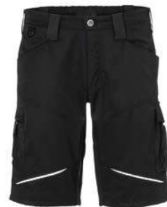
Schwarz 2950 5231-99 40-64