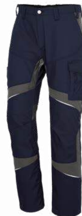
Dunkelblau | Anthrazit 2150 5365-4897 40-66, 90-118, 25-31