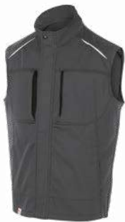
Anthrazit 7250 5365-97 XS-4XL