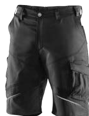
Schwarz 2450 5365-99 40-66