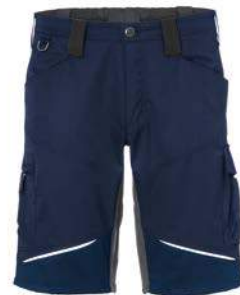
Dunkelblau | Anthrazit 2950 5231-4897 40-64