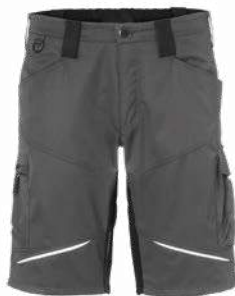
Anthrazit | Schwarz 2950 5231-9799 40-64