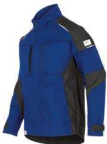
Kbl.blau | Schwarz 1250 3421-4699 XS-4XL