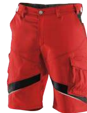
Mittelrot | Schwarz 2450 5365-5599 40-66