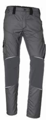
Anthrazit 2850 5231-97 40-66, 90-118, 23-31