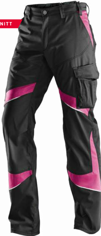
Schwarz | Pink 2550 5365-9952 D34-D54