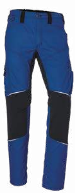
Kbl.blau | Schwarz 2850 5231-4699 40-66, 90-118, 23-31