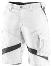
Weiß | Anthrazit 2450 5365-1097 40-66