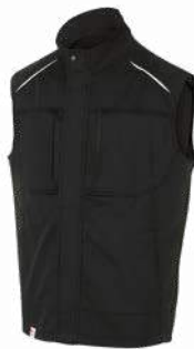
Schwarz 7250 5365-99 XS-4XL