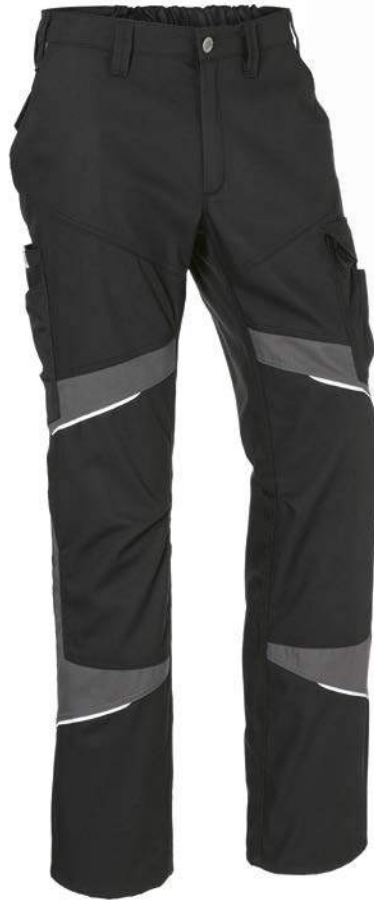
Schwarz | Anthrazit 2250 3421-9997 40-66, 90-118, 23-31