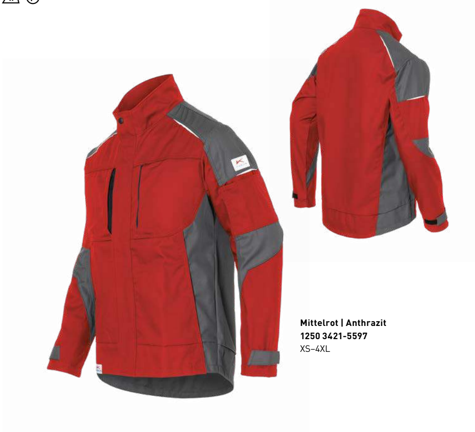
Mittelrot | Anthrazit 1250 3421-5597 XS-4XL