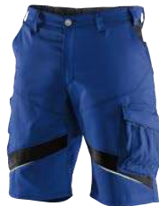
Kbl.blau | Schwarz 2450 5365-4699 40-66