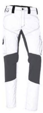
Weiß | Anthrazit 2850 5231-1097 40-66, 90-118, 23-31