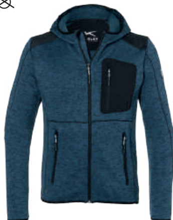
bleu foncé | noir 1441 6335-4899 XS-4XL