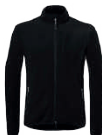
noir 1254 6201-99 XS-4XL