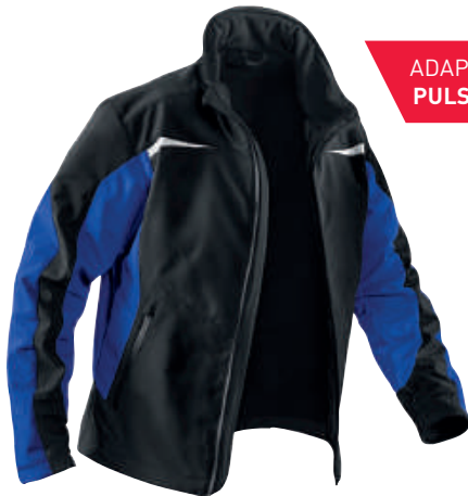
noir | bleu bleuet 1241 7322-9946 XS-4XL