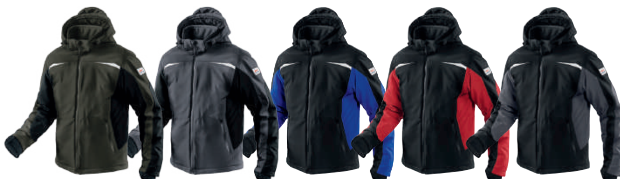
olive | noir 1041 7322-6699 XS-4XL