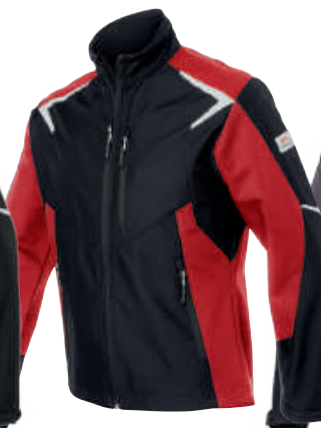
noir | rouge moyen 1425 5375-9955 XS-4XL