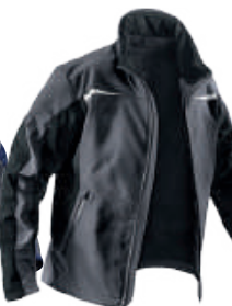
anthracite | noir 1241 7322-9799 XS-4XL