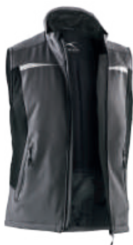
anthracite | noir 7041 7322-9799 XS-4XL