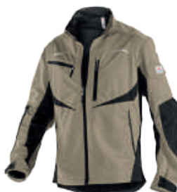
brun sable | noir 1351 5227-2599 XS-4XL