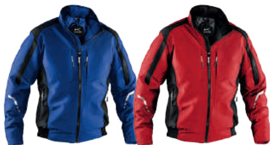
bleu bleuet | noir 1367 5229-4699 XS-4XL