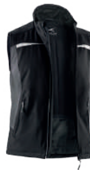
noir | anthracite 7041 7322-9997 XS-4XL