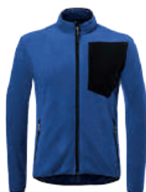
bleu bleuet | noir 1254 6201-4699 XS-4XL