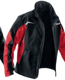
noir | rouge moyen 1241 7322-9955 XS-4XL