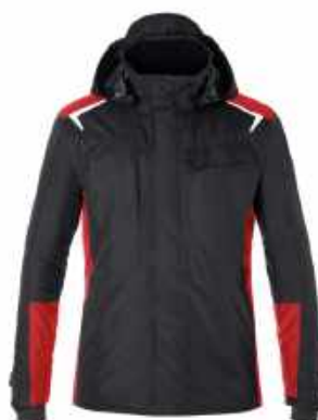
noir | rouge moyen 1326 8231-5599 XS-4XL