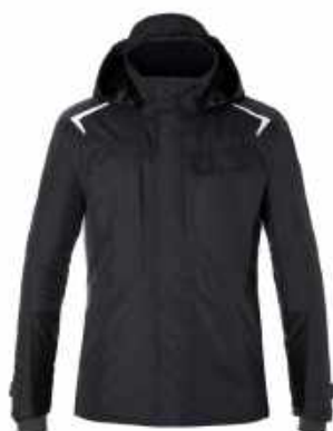
noir 1326 8231-99 XS-4XL