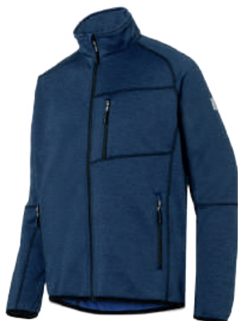
bleu foncé 1542 6410-48 XS-4XL