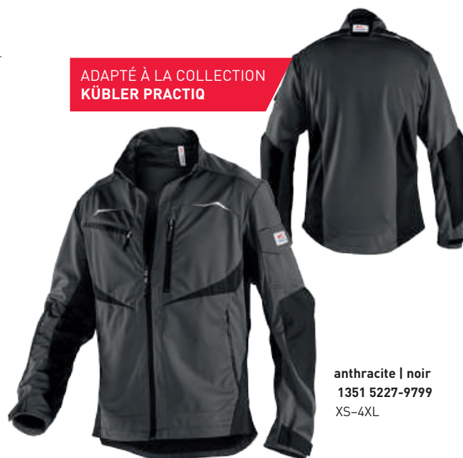
anthracite | noir 1351 5227-9799 XS-4XL