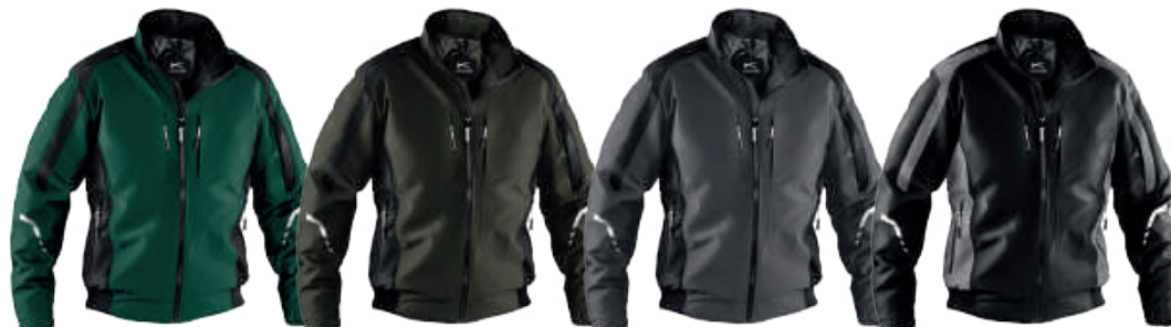
vert mousse | noir 1367 5229-6599 XS-4XL