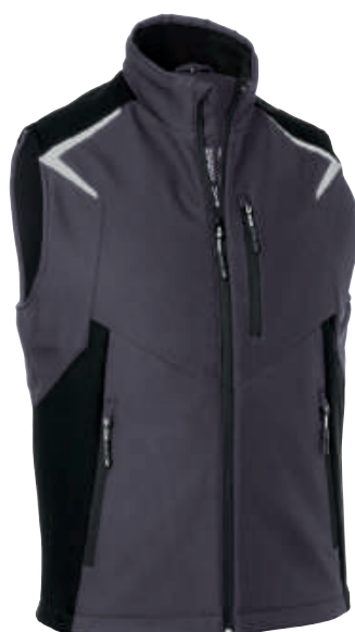
anthracite | noir 7125 5375-9799 XS-4XL