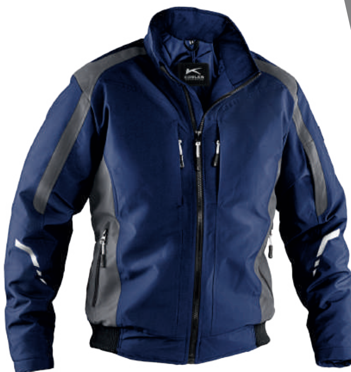
bleu foncé | anthracite 1367 5229-4897 XS-4XL