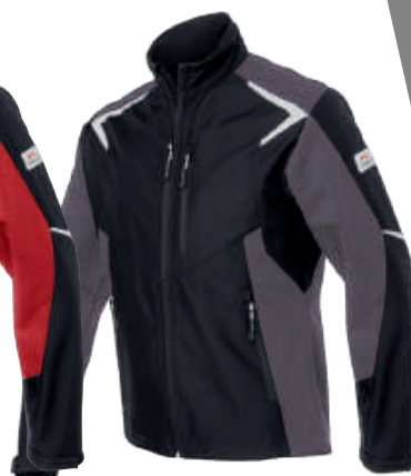
noir | anthracite 1425 5375-9997 XS-4XL