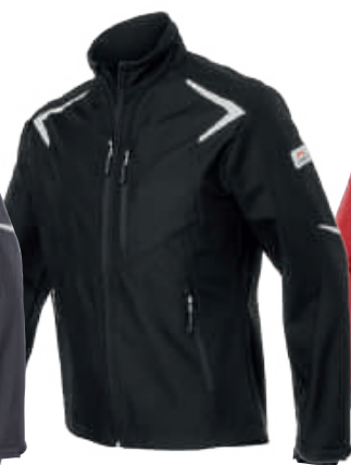
noir 1425 5375-99 XS-4XL