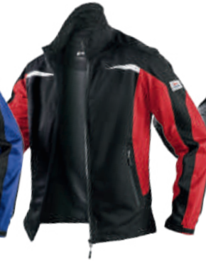
noir | rouge moyen 1141 5227-9955 XS-4XL