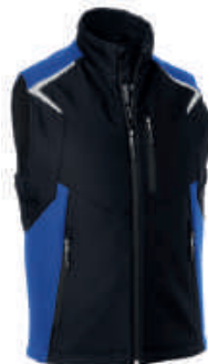
noir | bleu bleuet 7125 5375-9946 XS-4XL