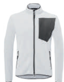
blanc | anthracite 1254 6201-1097 XS-4XL