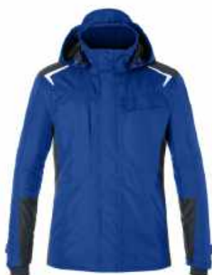
bleu bleuet | noir 1326 8231-4699 XS-4XL