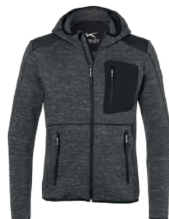
anthracite | noir 1441 6335-9799 XS-4XL