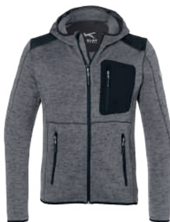
gris moyen | noir 1441 6335-9599 XS-4XL