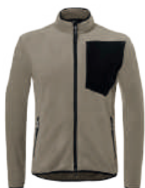
brun sable | noir 1254 6201-2599 XS-4XL