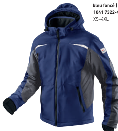
bleu foncé | anthracite 1041 7322-4897 XS-4XL