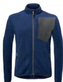
bleu foncé | anthracite 1254 6201-4897 XS-4XL