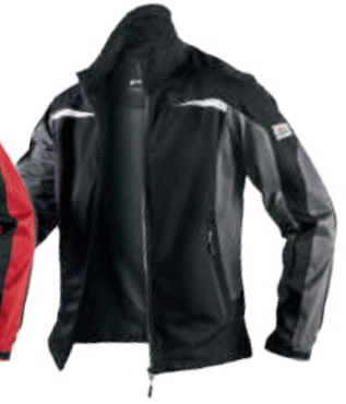
noir | anthracite 1141 5227-9997 XS-4XL