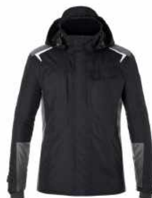
noir | anthracite 1326 8231-9997 XS-4XL