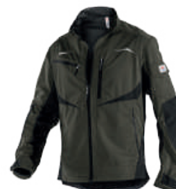
olive | noir 1351 5227-6699 XS-4XL