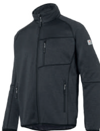
gris foncé 1542 6410-98 XS-4XL