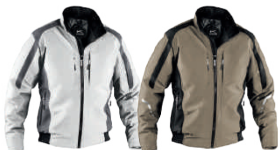
blanc | anthracite 1367 5229-1097 XS-4XL