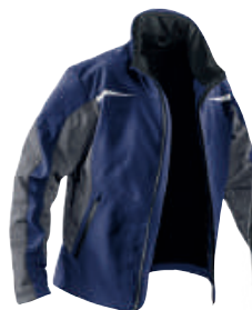
bleu foncé | anthracite 1241 7322-4897 XS-4XL