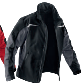
noir | anthracite 1241 7322-9997 XS-4XL