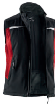
noir | rouge moyen 7041 7322-9955 XS-4XL