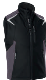
noir | anthracite 7125 5375-9997 XS-4XL