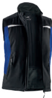
noir | bleu bleuet 7041 7322-9946 XS-4XL