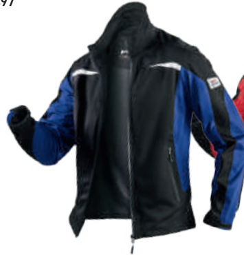
noir | bleu bleuet 1141 5227-9946 XS-4XL