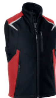
noir | rouge moyen 7125 5375-99955 XS-4XL