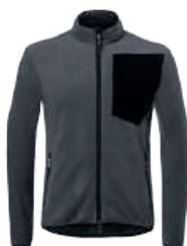
anthracite | noir 1254 6201-9799 XS-4XL