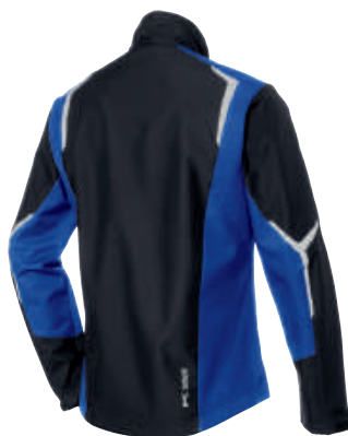
noir | bleu bleuet 1425 5375-9946 XS-4XL