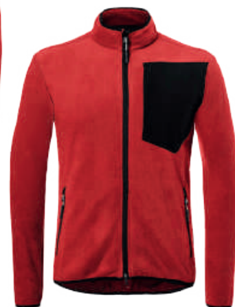
rouge moyen | noir 1254 6201-5599 XS-4XL