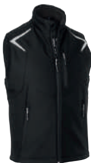
noir 7125 5375-99 XS-4XL