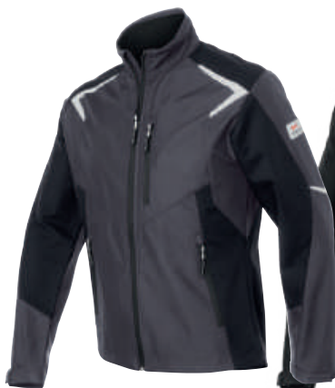
anthracite | noir 1425 5375-9799 XS-4XL