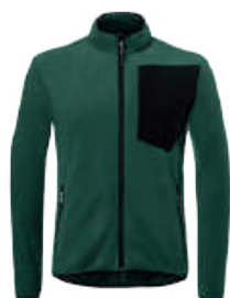
vert mousse | noir 1254 6201-6599 XS-4XL