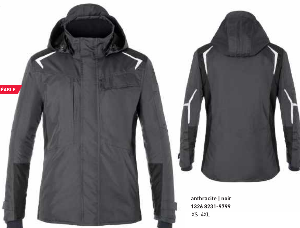
anthracite | noir 1326 8231-9799 XS-4XL