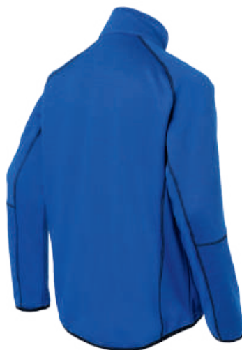
bleu bleuet 1542 6410-46 XS-4XL