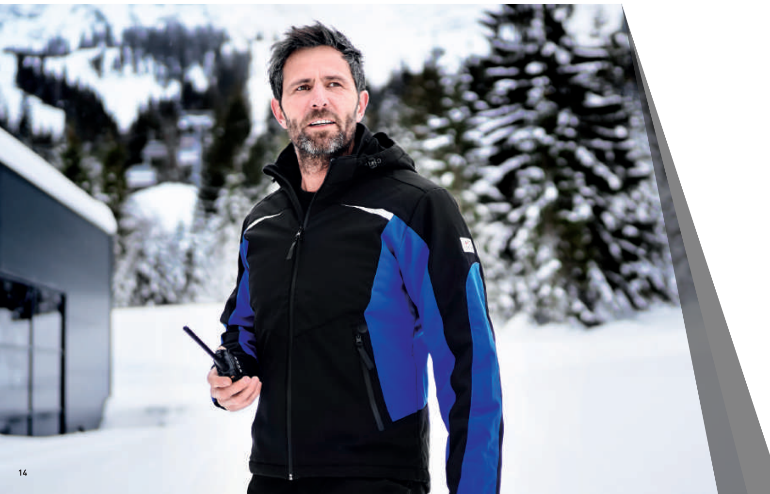
noir | anthracite 1041 7322-9997 XS-4XL