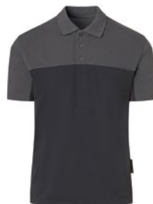
Schwarz | Dunkelgrau 5221 6207-9998 XS-4XL