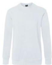
Weiß 5234 6406-10 XS-6XL