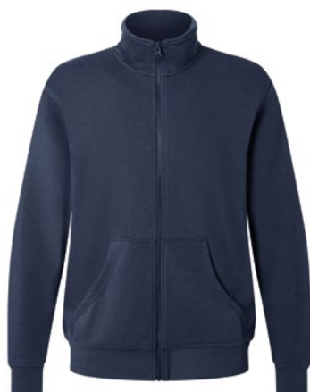
Dunkelblau 5235 6406-48 XS-4XL