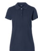
Dunkelblau 5233 6207-48 XS-4XL