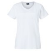
Weiß 5231 6266-10 XS-4XL (ca. 190 g/m 2 )