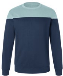
Dunkelblau | Eisblau 5222 6406-4844 XS-4XL