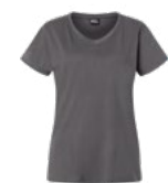
Anthrazit 5231 6206-97 XS-4XL