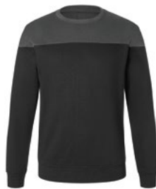
Schwarz | Dunkelgrau 5222 6406-9998 XS-4XL