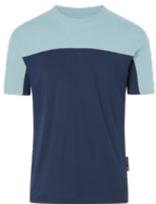
Dunkelblau | Eisblau 5220 6206-4844 XS-4XL