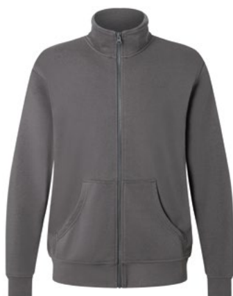
Anthrazit 5235 6406-97 XS-4XL