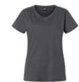
Dunkelgrau 5231 6206-98 XS-4XL