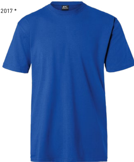
Kbl.blau 5230 6206-46 XS-6XL