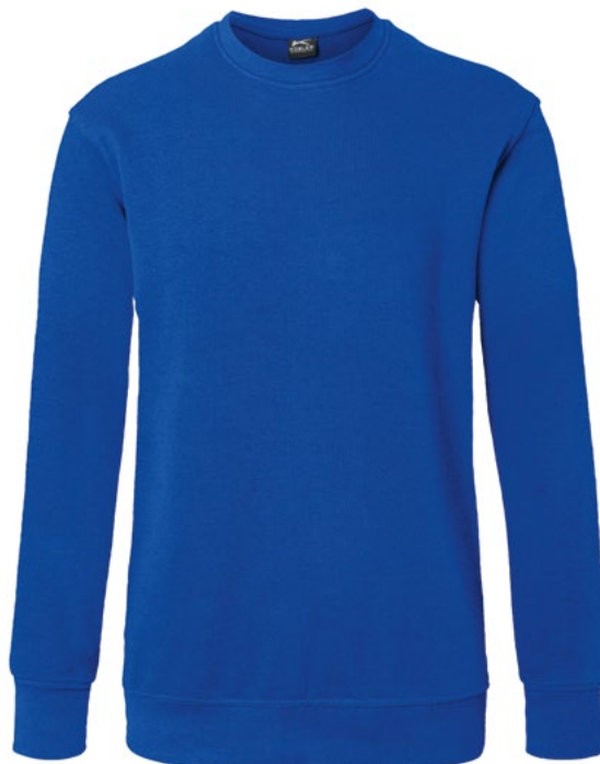
Kbl.blau 5234 6406-46 XS-6XL