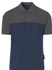
Dunkelblau | Dunkelgrau 5221 6207-4898 XS-4XL