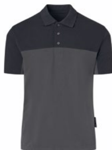
Dunkelgrau | Schwarz 5221 6207-9899 XS-4XL