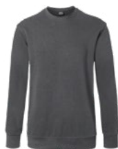
Dunkelgrau 5234 6406-98 XS-6XL