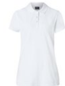
Weiß 5233 6306-10 XS-4XL (ca. 240 g/m 2 )