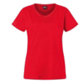
Mittelrot 5231 6206-55 XS-4XL