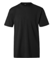
Schwarz 5230 6206-99 XS-6XL