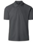
Dunkelgrau 5232 6207-98 XS-6XL