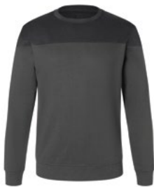
Dunkelgrau | Schwarz 5222 6406-9899 XS-4XL