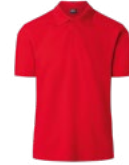
Mittelrot 5232 6207-55 XS-6XL