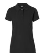
Schwarz 5233 6207-99 XS-4XL