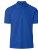
Kbl.blau 5232 6207-46 XS-6XL