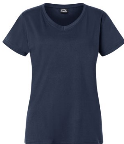
Dunkelblau 5231 6206-48 XS-4XL