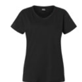
Schwarz 5231 6206-99 XS-4XL