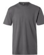
Anthrazit 5230 6206-97 XS-6XL