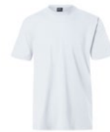
Weiß 5230 6206-10 XS-6XL