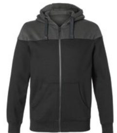
Schwarz | Dunkelgrau 5223 6406-9998 XS-4XL