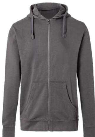
Anthrazit 5236 6406-97 XS-4XL