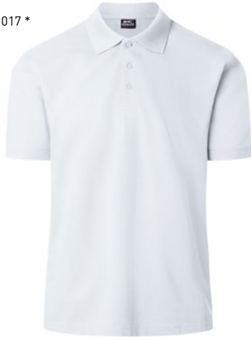
Weiß 5232 6207-10 XS-6XL