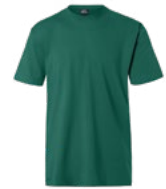
Moosgrün 5230 6206-65 XS-6XL