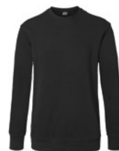
Schwarz 5234 6406-99 XS-6XL