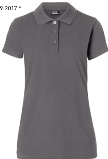
Anthrazit 5233 6207-97 XS-4XL