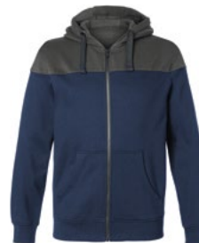
Dunkelblau | Dunkelgrau 5223 6406-4898 XS-4XL