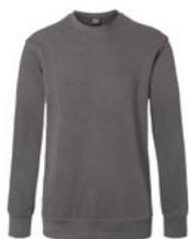
Anthrazit 5234 6406-97 XS-6XL