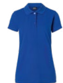
Kbl.blau 5233 6207-46 XS-4XL