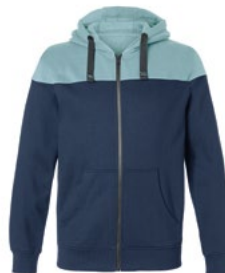
Dunkelblau | Eisblau 5223 6406-4844 XS-4XL