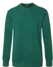
Moosgrün 5234 6406-65 XS-6XL