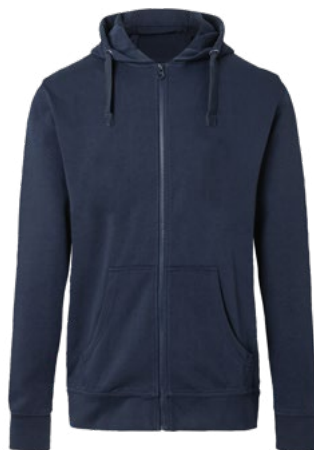
Dunkelblau 5236 6406-48 XS-4XL