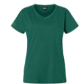
Moosgrün 5231 6206-65 XS-4XL