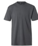
Dunkelgrau 5230 6206-98 XS-6XL