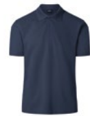
Dunkelblau 5232 6207-48 XS-6XL