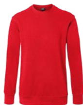
Mittelrot 5234 6406-55 XS-6XL