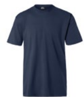
Dunkelblau 5230 6206-48 XS-6XL