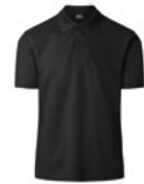
Schwarz 5232 6207-99 XS-6XL