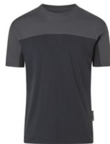
Schwarz | Dunkelgrau 5220 6206-9998 XS-4XL