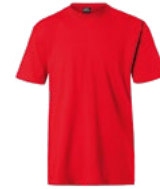
Mittelrot 5230 6206-55 XS-6XL