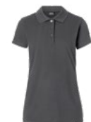
Dunkelgrau 5233 6207-98 XS-4XL