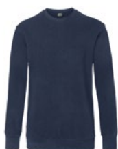
Dunkelblau 5234 6406-48 XS-6XL