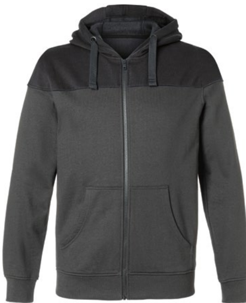
Dunkelgrau | Schwarz 5223 6406-9899 XS-4XL