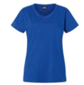
Kbl.blau 5231 6206-46 XS-4XL