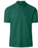
Moosgrün 5232 6207-65 XS-6XL