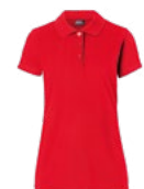
Mittelrot 5233 6207-55 XS-4XL