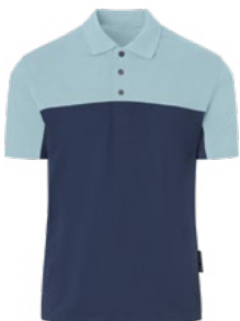
Dunkelblau | Eisblau 5221 6207-4844 XS-4XL