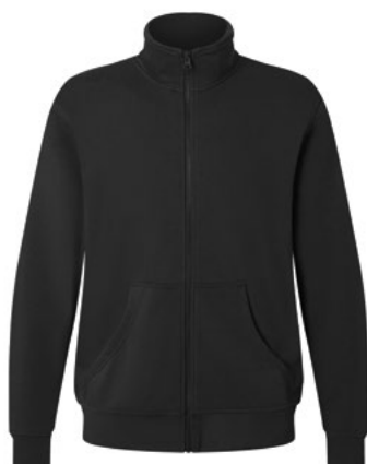
Schwarz 5235 6406-99 XS-4XL