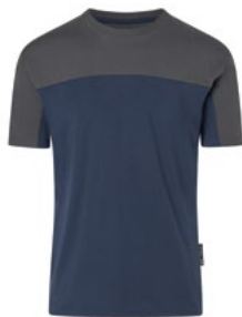
Dunkelblau | Dunkelgrau 5220 6206-4898 XS-4XL