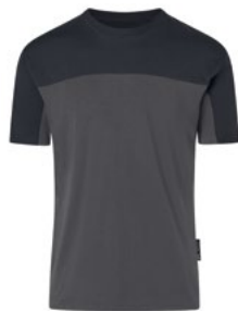
Dunkelgrau | Schwarz 5220 6206-9899 XS-4XL