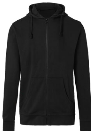
Schwarz 5236 6406-99 XS-4XL