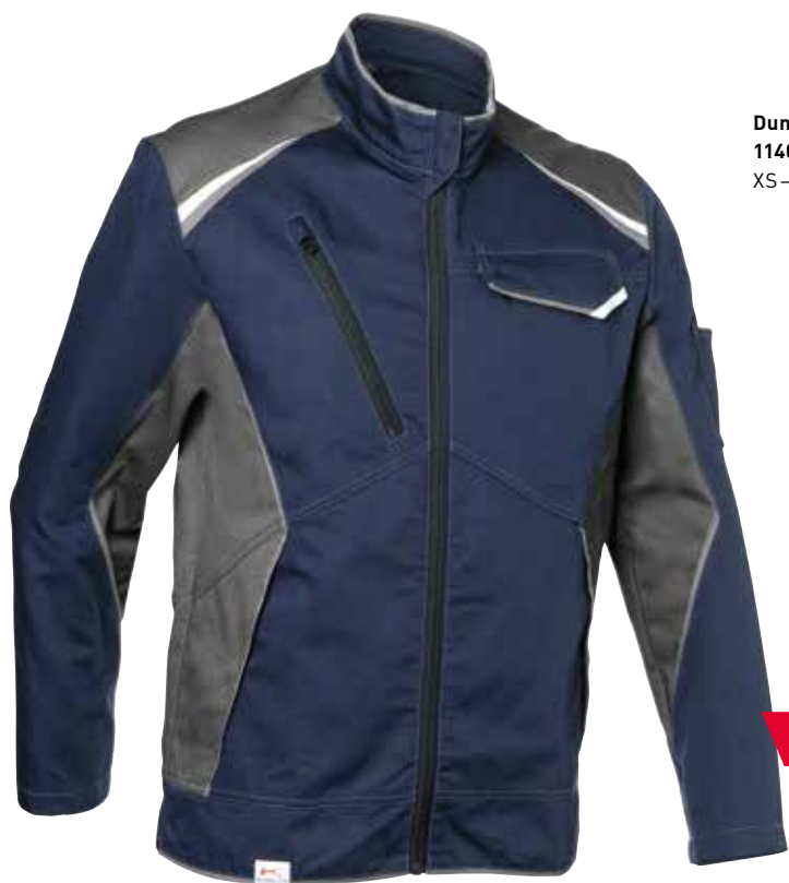
Dunkelblau | Anthrazit 1140 5336-4897 XS-4XL