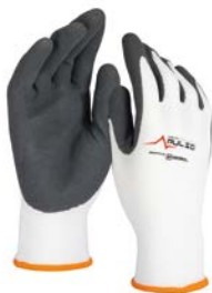
HOMMES blanc 8001 8907 15-10 8-11