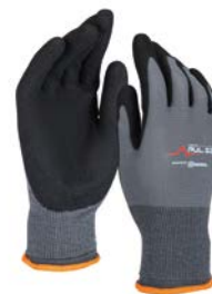
HOMMES anthracite 8001 8907 15-97 8-11