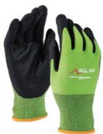
HOMMES vert fluo 8001 8906 13-63 8-11