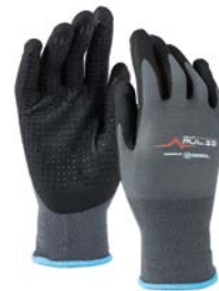
FEMMES anthracite 8001 8908 14-97 6-8