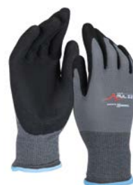
FEMMES anthracite 8001 8909 16-97 6-8