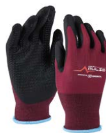
FEMMES bordeaux 8001 8908 14-58 6-8