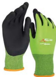
HOMMES vert fluo 8001 8907 15-63 8-11