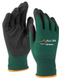
HOMMES vert mousse 8001 8906 13-65 8-11