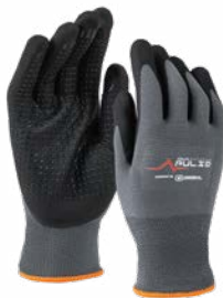
HOMMES anthracite 8001 8906 13-97 8-11