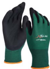
HOMMES vert mousse 8001 8907 15-65 8-11