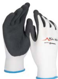
FEMMES blanc 8001 8909 16-10 6-8