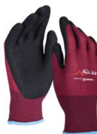
FEMMES bordeaux 8001 8909 16-58 6-8